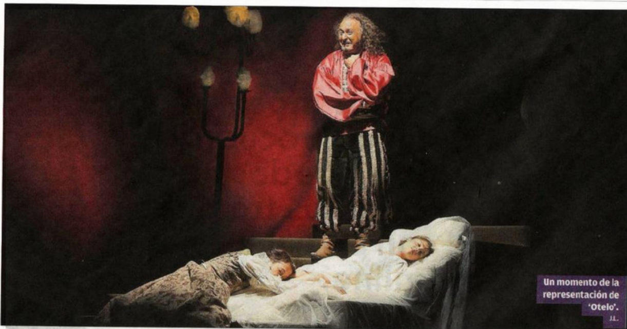
Un momento de la representación de 'Otelo'.