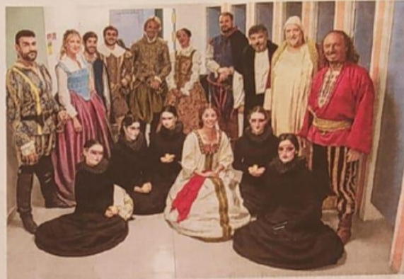
Grupo de actores de la compañía Ditirambo.